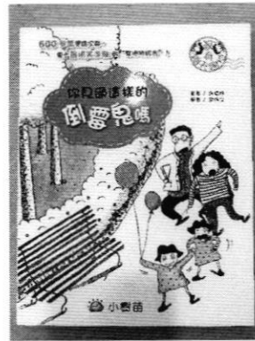
P.4-P.6 學生獲贈的圖書《你見過這樣的倒霉鬼嗎?》