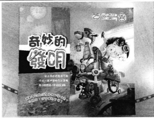
P.1-P.3 學生獲贈的圖書《奇妙的發明》