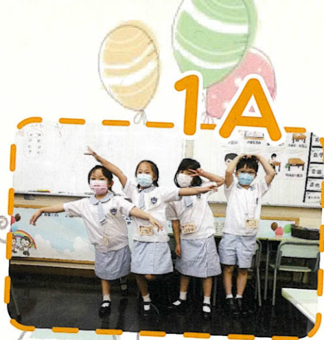
吳嘉雯 柯莎娜 彭思齊 沈宇軒